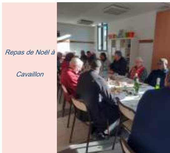
Repas de Noël à Cavillon