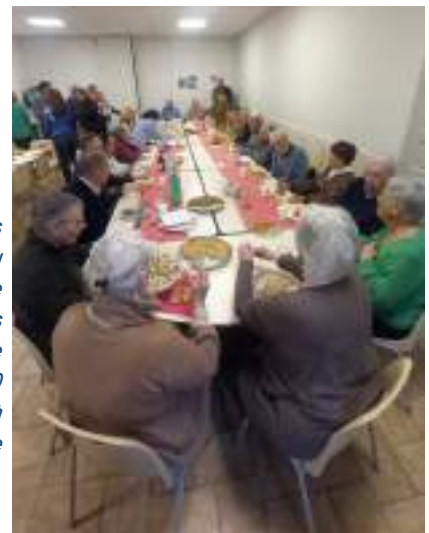
Repas partagé au presbytère après la Messe du 30 novembre à Orange

Par ailleurs, l'équipe se réunit chaque trimestre pour préparer la Lettre Fraternelle envoyée à l'ensemble du réseau.