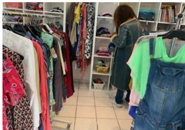
Boutique solidaire de Monteux

■ La boutique d'Apt La boutique d'Apt est ouverte chaque mardi après-midi et samedi matin tout au long de l'année. Les produits sont essentiellement des vêtements d'occasion auxquels s'ajoutent des livres et des articles de brocante. Depuis 2024, une fois par mois, la boutique bénéficie d'un approvisionnement complémentaire de vêtements fournis par la boutique de Pernes Les Fontaines. Ce partenariat permet de répondre aux demandes en constante augmentation.