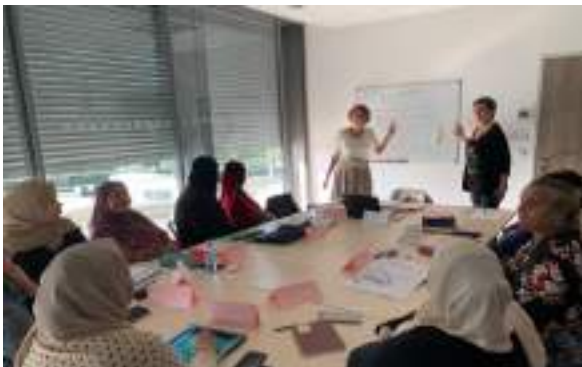
Cours d'apprentissage du français à Vedène

Au total 29 bénévoles de 5 équipes animent la thématique : Accueil de Jour d'Avignon, Mazan, Vedène, Carpentras,