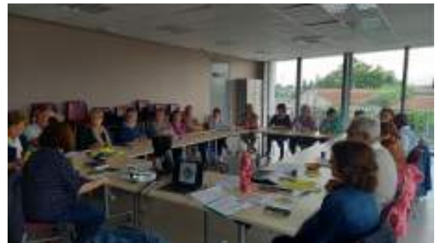
Journée Politique d'accompagnement - avril 2024 à Vedène

Pour toutes ces raisons, des temps de "Rencontre de proximité" sont organisés régulièrement sur chaque territoire ainsi que des sessions de formation à la politique d'accompagnement au Secours Catholique.