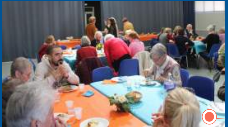
Table Ouverte Partagée à Montoux

Le trio de chanteuses a interprété, à capella, standards de gospel et chants de Noël devant un public conquis.