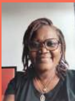
Bénévole à la délégation

« Je suis bénévole rattachée à la délégation du Secours Catholique depuis peu, arrivée en soutien du pôle administratif. Je suis ravie d'être au cœur d'une équipe pluridisciplinaire qui m'a confié différentes tâches administratives et comptables pour lesquelles je peux mettre en pratique mes compétences et en acquérir de nouvelles.