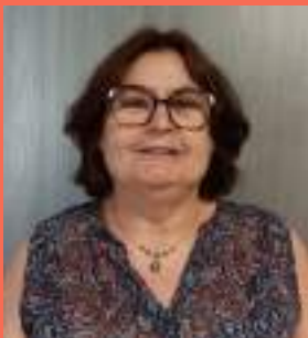
Assistante de Délégation

« Suite à une longue absence pour maladie, j'ai retrouvé mon poste avec joie en janvier 2024.