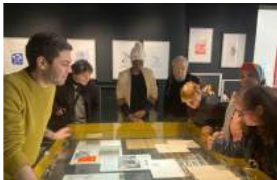
Sortie à la Maison Jean Vilar

■ A Avignon , l'Accueil de Jour alterne sorties culturelles ou dédiées à la détente pour répondre aux envies et tempérament de chacun.