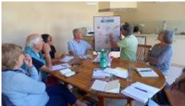
Réunion d'équipe à Vaison La Romaine L'occasion de revoir ensemble les 11 repères de l'aide financière

Pour prendre les décisions qui s'imposent, ses membres s'appuient notamment sur la méthodologie du Secours Catholique, notamment la boussole des aides et les 11 repères de l'aide financière.