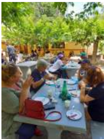
Pique-nique à l'île de la Barthelasse

En remerciement de leur engagement au quotidien, tous sont conviés au Parc des Libertés de la Barthelasse pour un déjeuner convivial et fraternel.