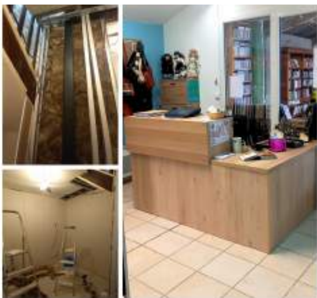
Travaux d'amélioration à la boutique solidaire de Pernes Les Fontaines

Soucieuse de s'inscrire toujours davantage dans une dynamique vertueuse, l'équipe a candidaté en 2024 pour un Appel à Manifestation d'Intérêt. Engagée à suivre la traçabilité et le taux de réemploi des vêtements qui transitent à la boutique, l'équipe a pu bénéficier de fonds pour l'achat d'équipement adapté la réalisation des aménagements nécessaires.