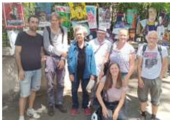
Sortie théâtre au Festival d'Avignon

A Apt , tous les quinze jours environ, une randonnée ou une promenade s'organise pour rompre l'isolement de personnes qui vivent seules et leur permettre de passer un moment de joie fraternelle.