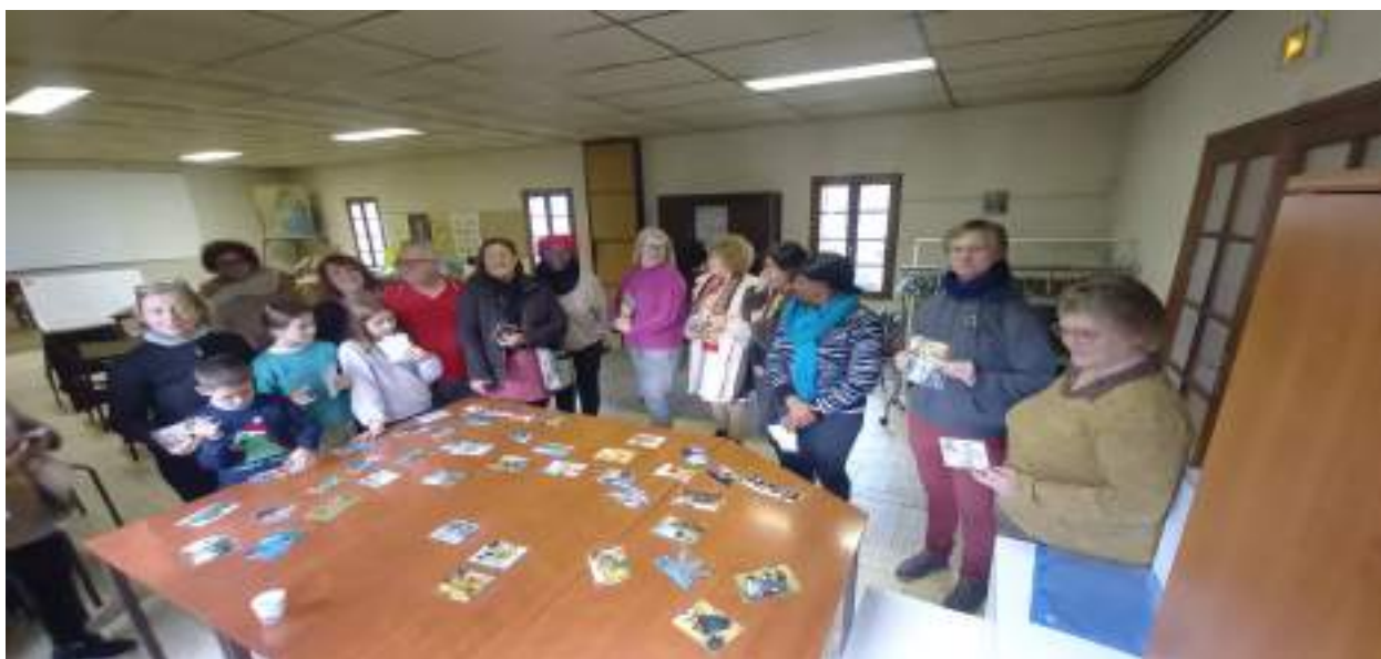
Réunion de présentation du projet final aux futurs participants

- La traçabilité du réemploi solidaire des textiles à Monteux et Pernes Les Fontaines